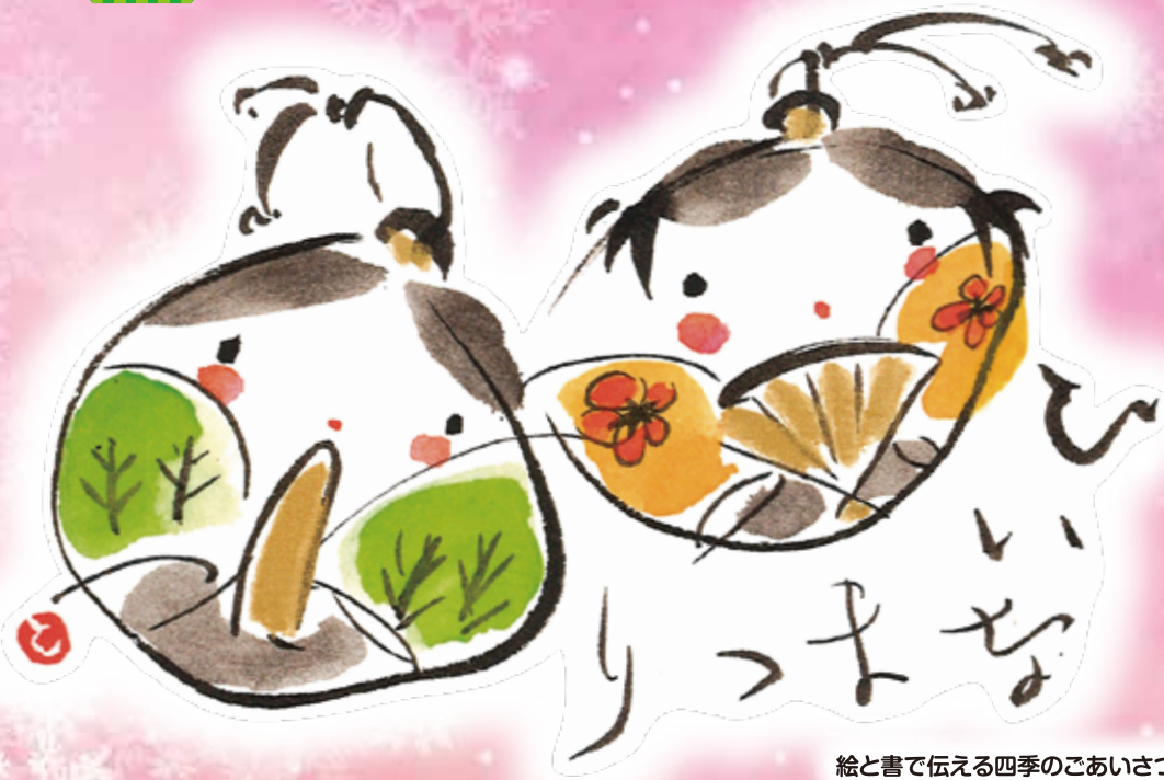
絵と書で伝える四季のごあいさつ