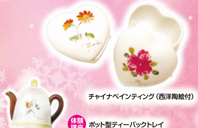
チャイナペインティング (西洋陶絵付)